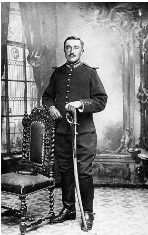
NR-Collection JP Pérou