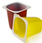
Pots de yaourts

La collecte du tri sélectif à Montamisé est effectuée le mercredi après-midi Pensez à sortir votre bac le matin-même