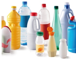
Bouteilles et contenants plastiques