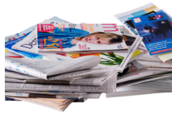
Papiers et journaux