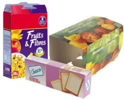
Emballages alimentaires carton