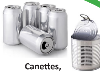
Canettes, conserves & aluminium