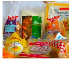
Emballages alimentaires plastiques