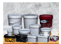
Contenants de produits bricolage (peintures, solvants, huile de moteur...)